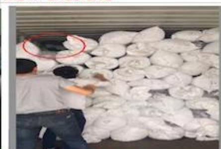
TRY BEST TO LOAD FULL