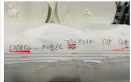
DETAILS ON FABRIC