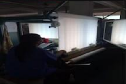
FABRIC FIRST TIME CHECKING