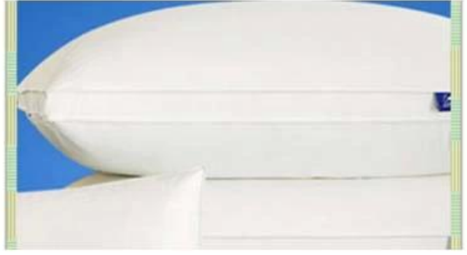
making mattress for pollows