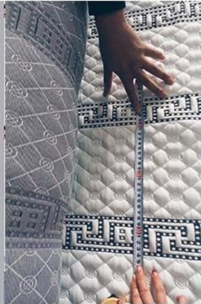
загрузить полную проверку