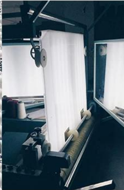
проверки качества ткани