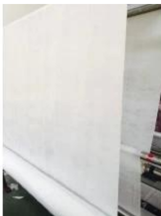
Печатный матрац Фабрика тканей Stichbond