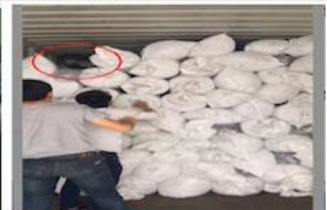
TRY BEST TO LOAD FULL