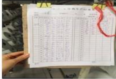
DETAILS NOTE DOWN