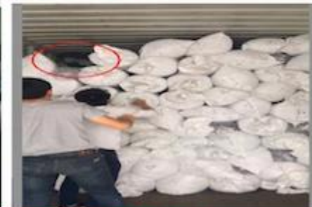
TRY BEST TO LOAD FULL