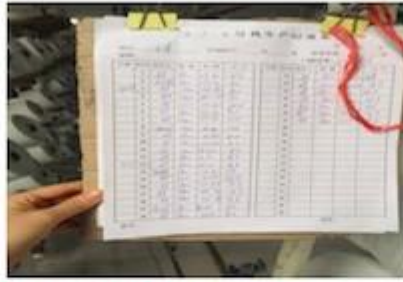
DETAILS NOTE DOWN