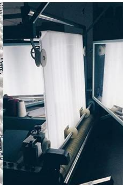
verificação de qualidade de tecido