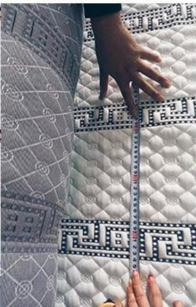
verificação de design