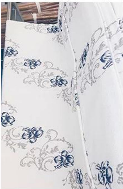
verificação de design / quantidade