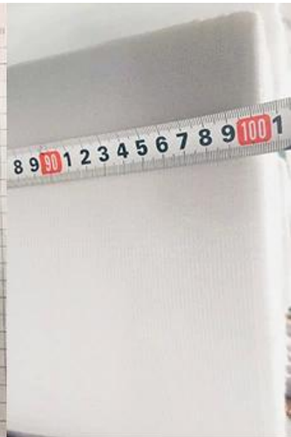
largura de verificação