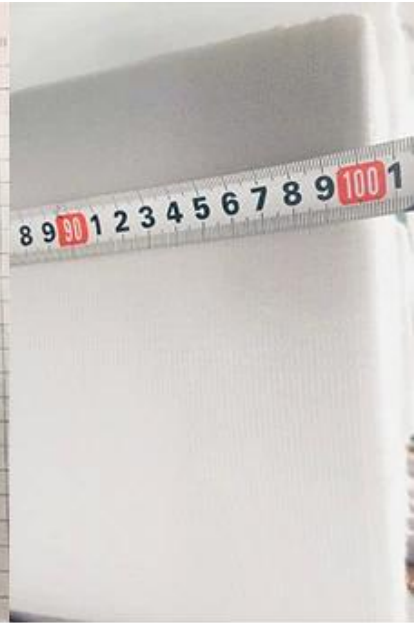
largura de verificação