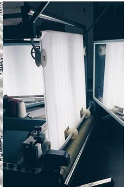
verificação de qualidade de tecido