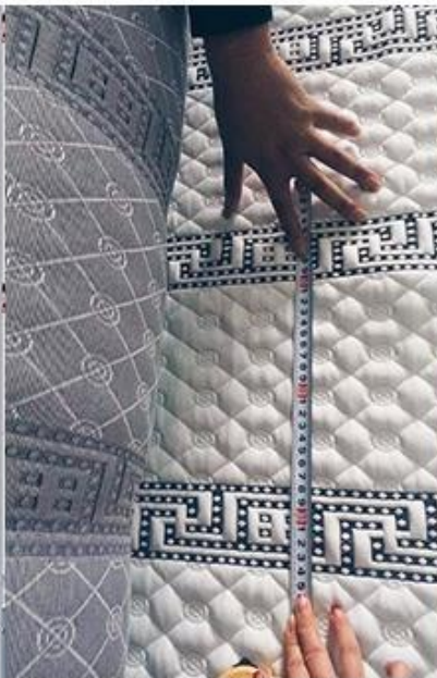
verificação de design