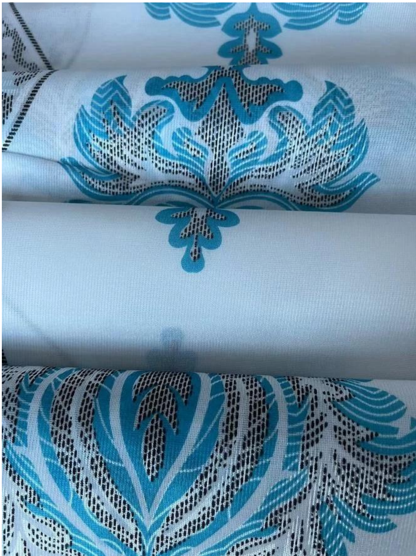
Tecido de colchão por atacado china