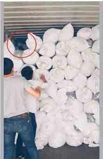
probeer het best om vol te laden