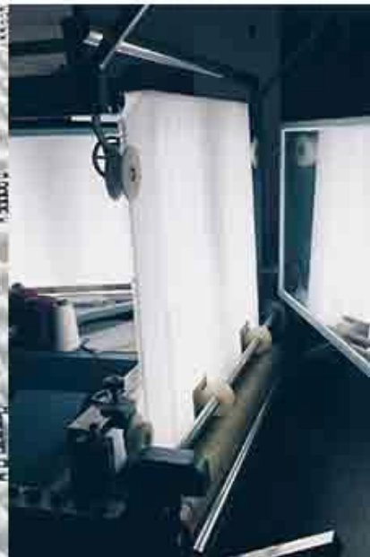
controle van de stofkwaliteit