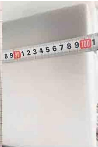
controllando la larghezza