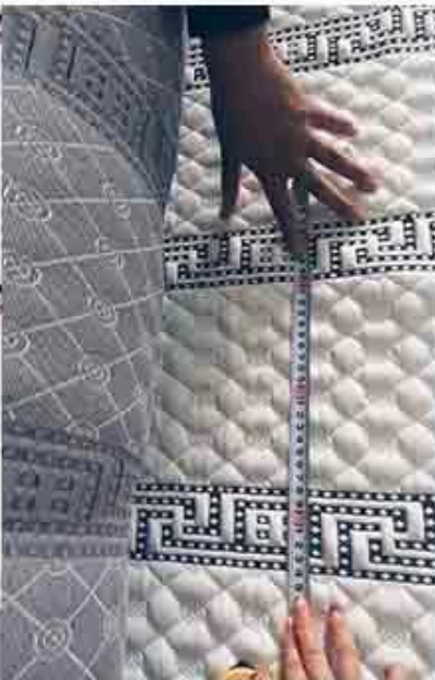
controllo del design