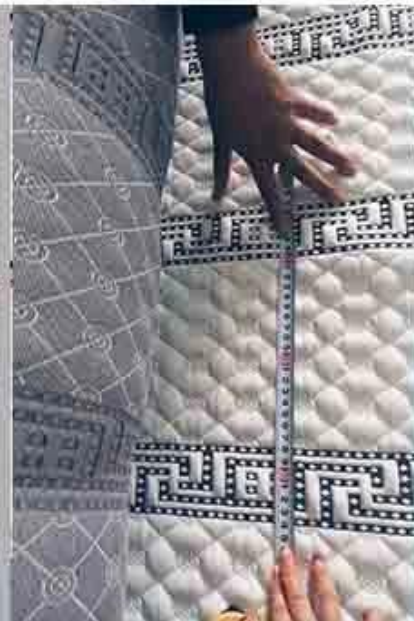
controllo del design