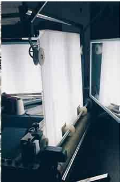
controllo qualità del tessuto