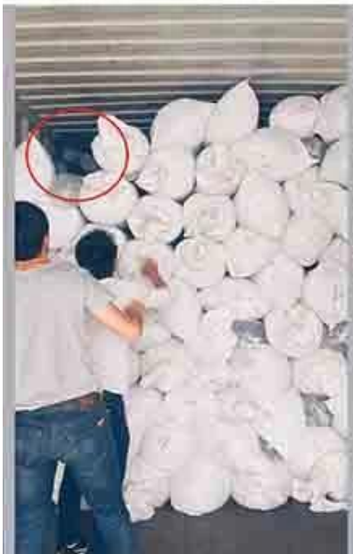
prova meglio per caricare pieno