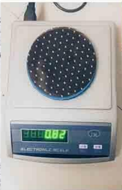
controllo del peso