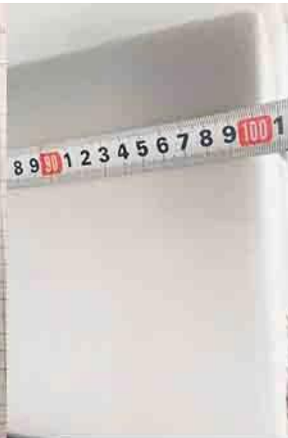
controllando la larghezza