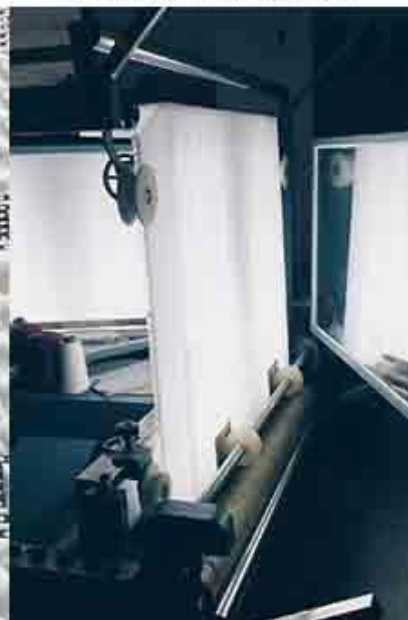
controllo qualità del tessuto