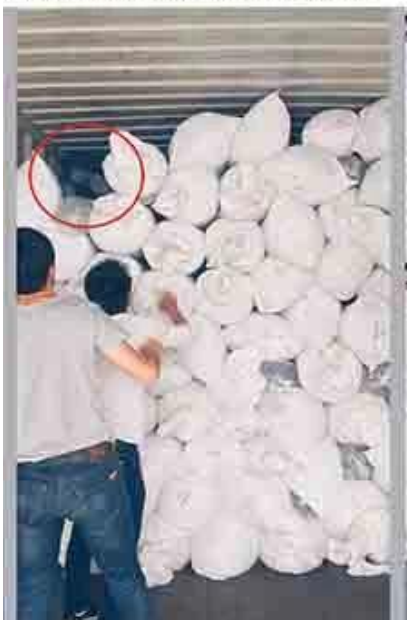
prova meglio per caricare pieno