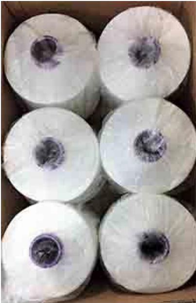
metro di abete e filato costante