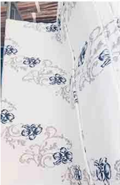
controllo di disegno / quantità