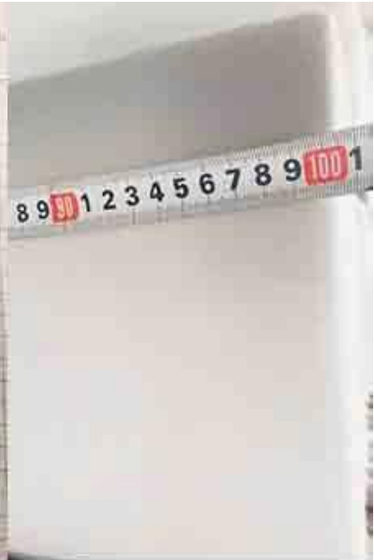
controllando la larghezza