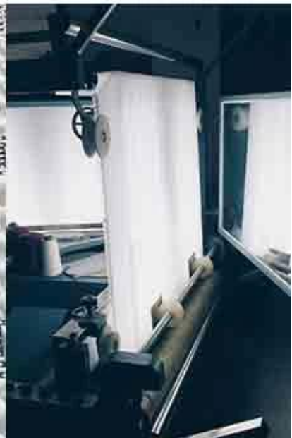
controllo qualità del tessuto