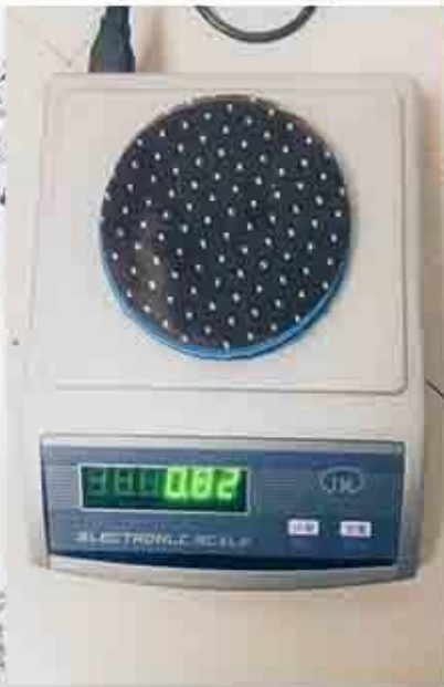
controllo del peso