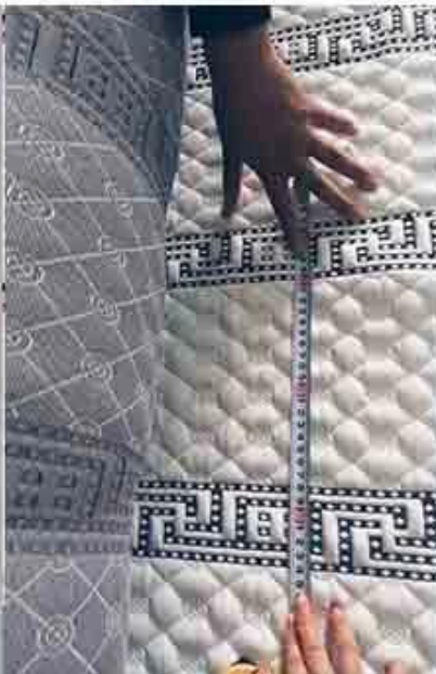
controllo del design