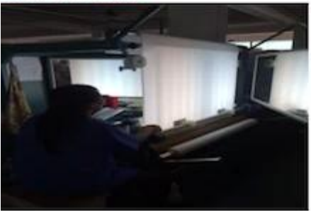
FABRIC FIRST TIME CHECKING