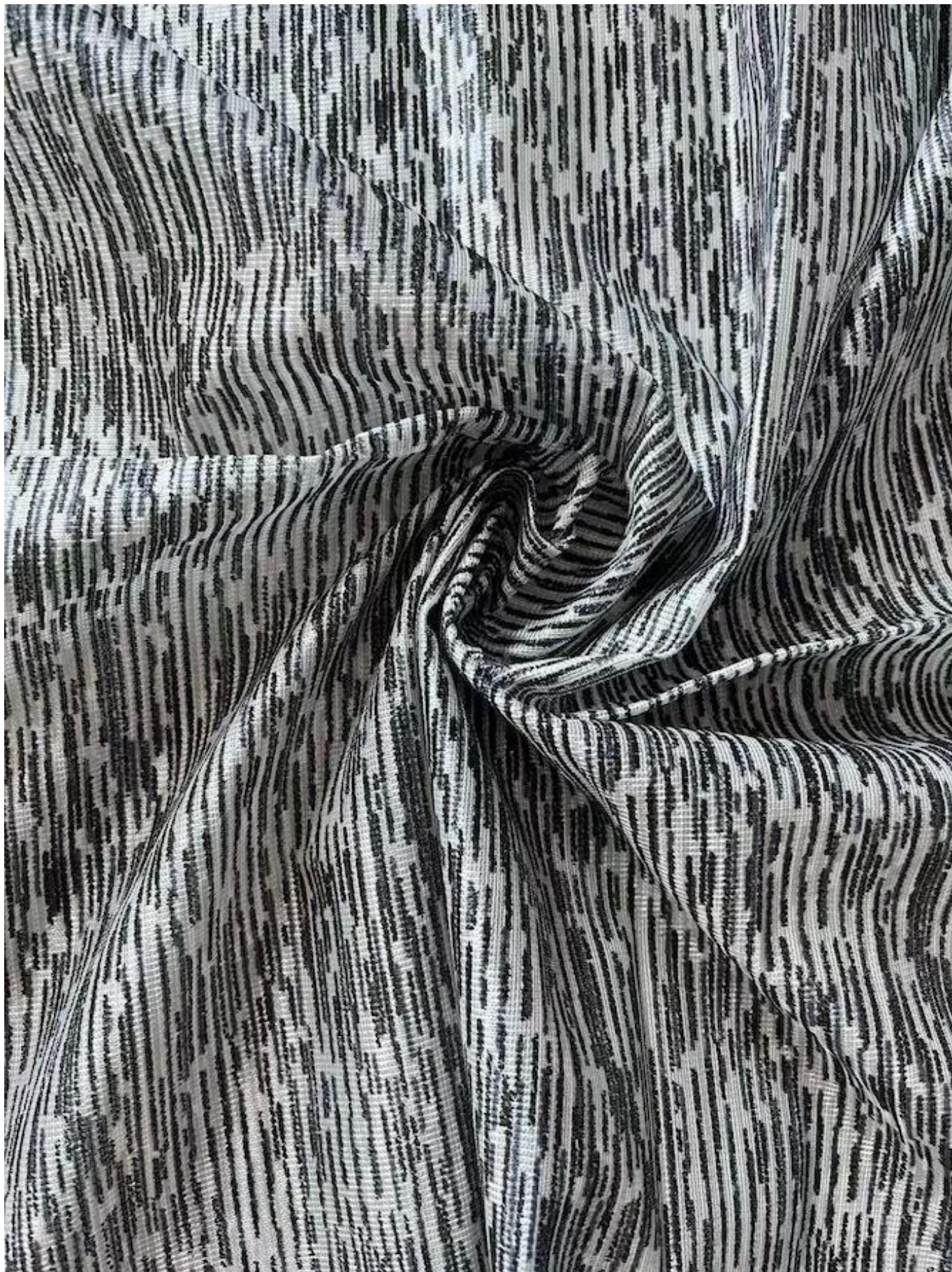
Fabbrica di tessuti per materassi a maglia in Cina