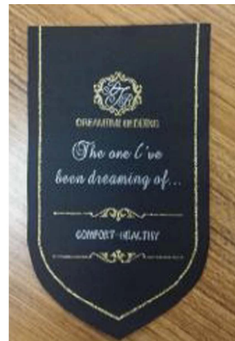
ετικέτες στρώματος ετικέτα στρώματος