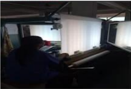
FABRIC FIRST TIME CHECKING