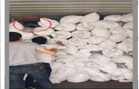
TRY BEST TO LOAD FULL