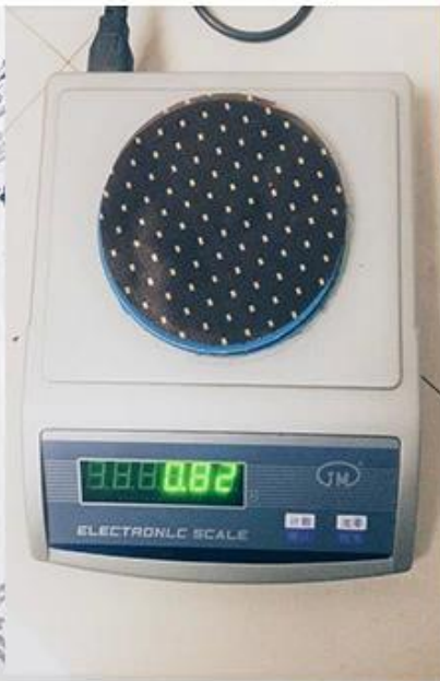
vérification du poids