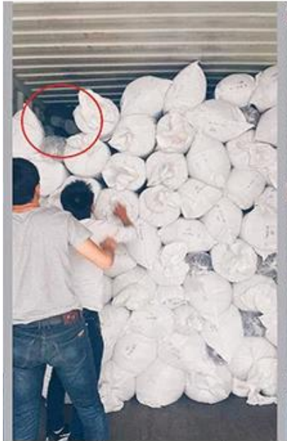
essayez de charger au mieux