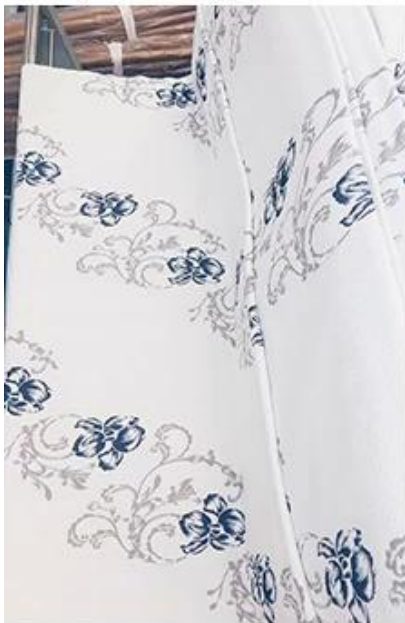
conception / vérification de la quantité