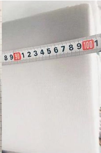
vérifier la largeur