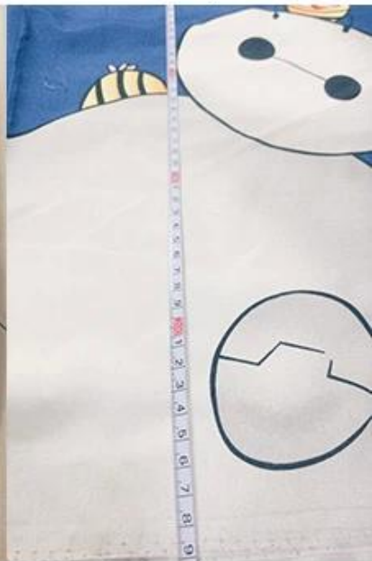
vérification de la largeur