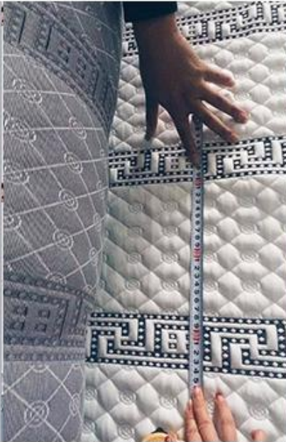
vérification de la conception