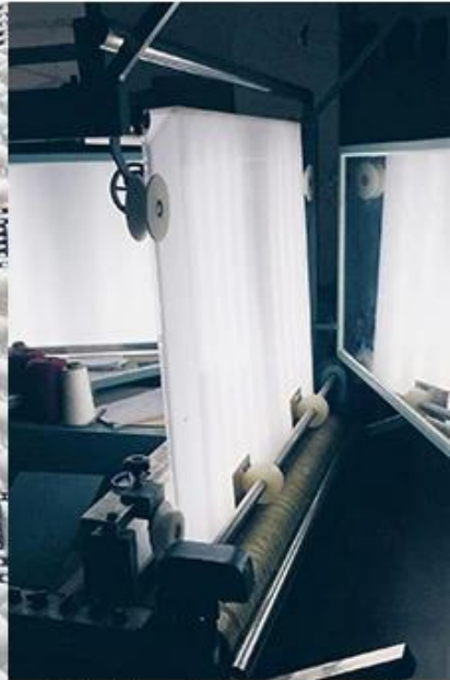
vérification de la qualité du tissu