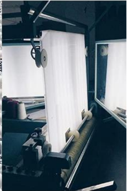
fabric quality check