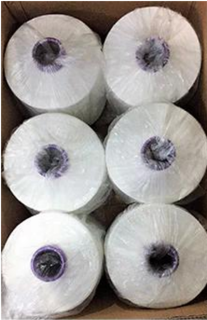
fir meter and steady yarn