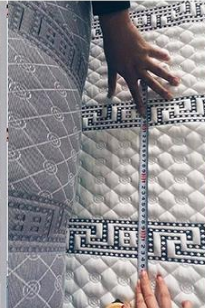
vérification de la conception