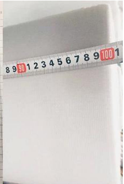
vérifier la largeur