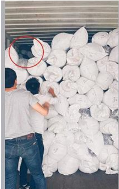
essayez de charger au mieux