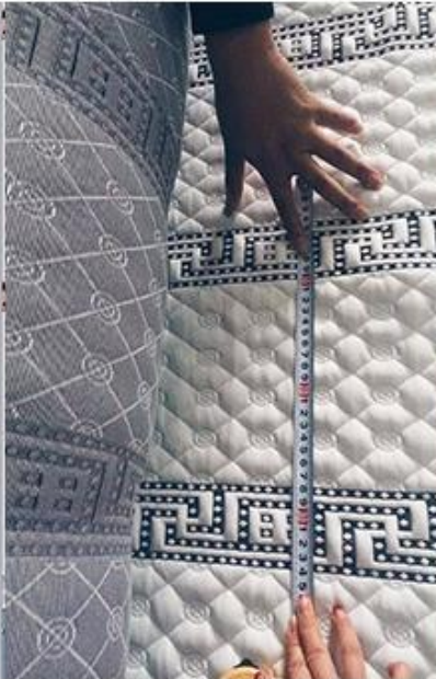
vérification de la conception