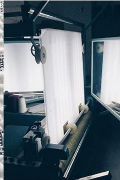
vérification de la qualité du tissu