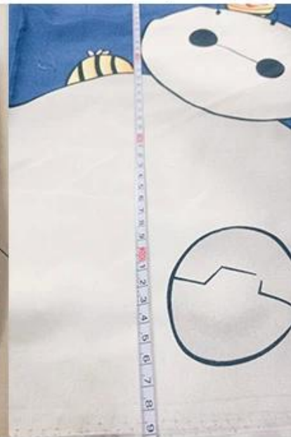
vérification de la largeur