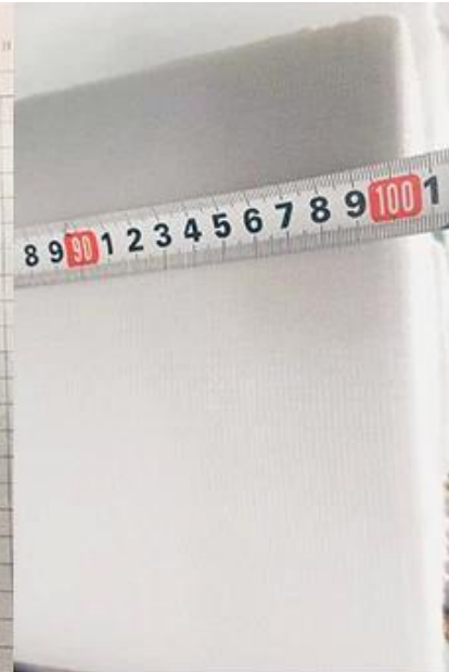
vérifier la largeur