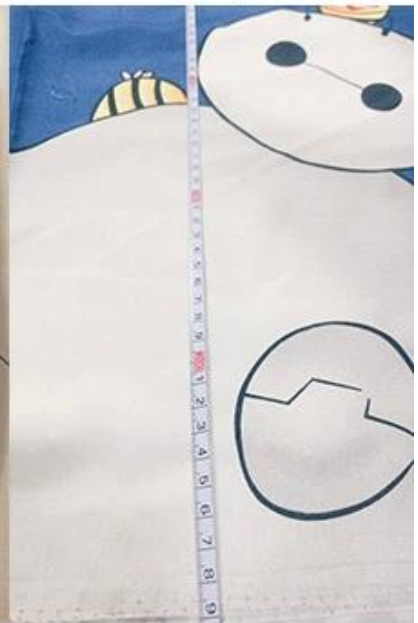
vérification de la largeur