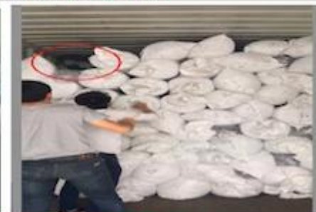
TRY BEST TO LOAD FULL