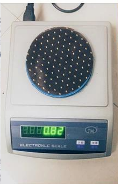
control de peso