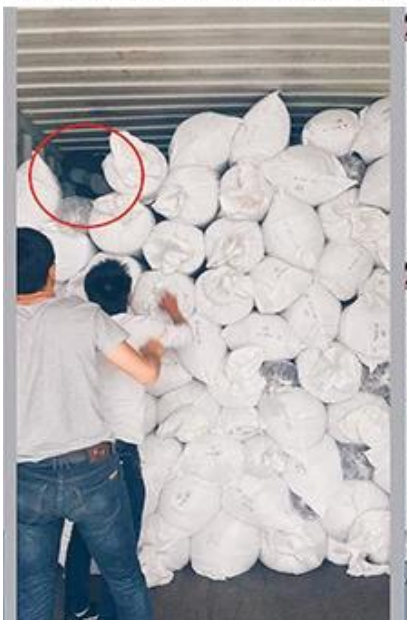
intenta cargar mejor lleno