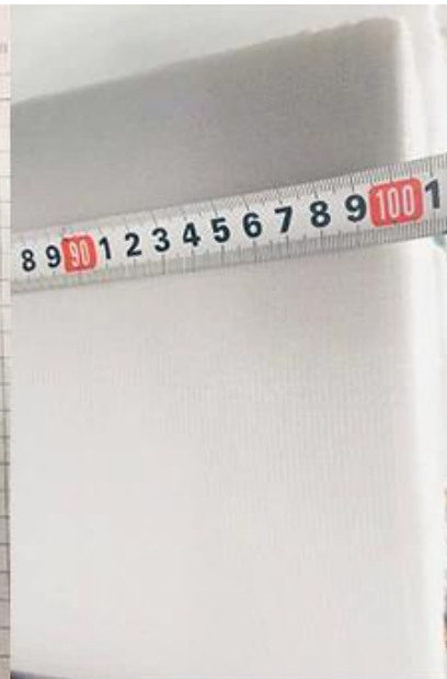
ancho de comprobación