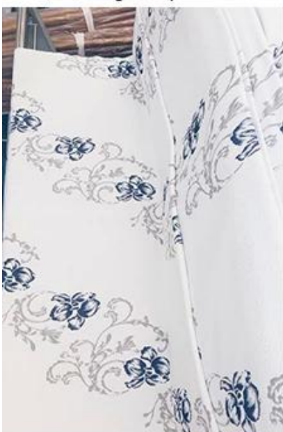
control de diseño / cantidad