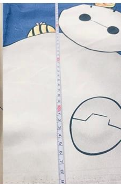
verificación de ancho