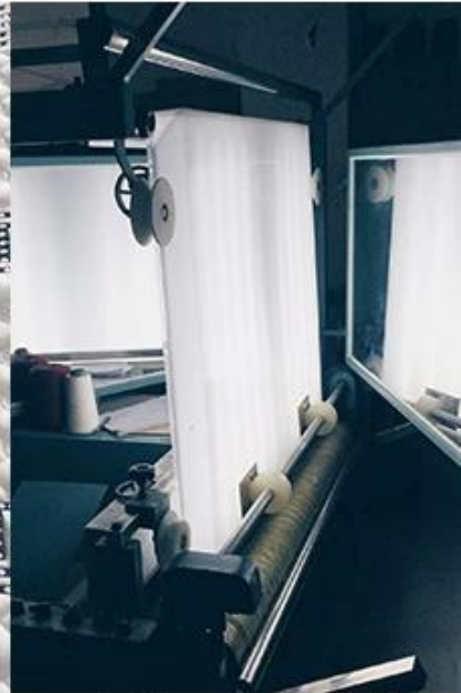
control de calidad de la tela