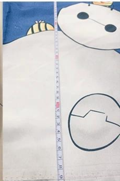
verificación de ancho