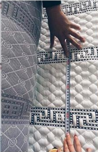
control de diseño