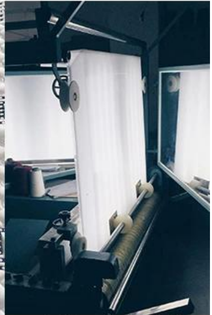
control de calidad de la tela