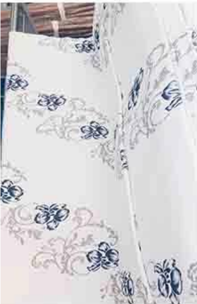
Design / Mengenprüfung