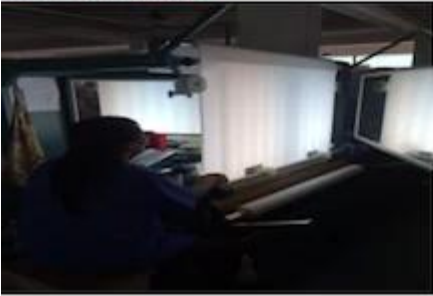
FABRIC FIRST TIME CHECKING