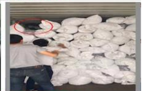
TRY BEST TO LOAD FULL