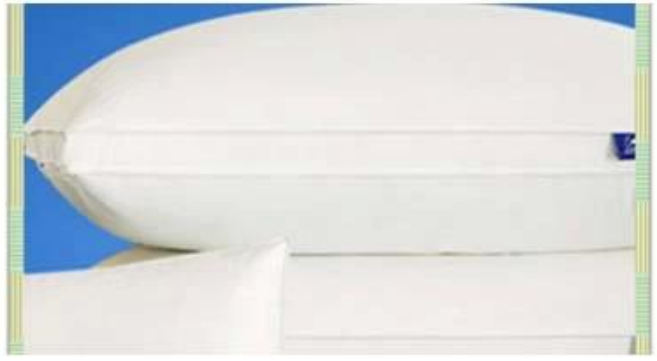
making mattress for pollows