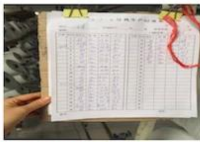
DETAILS NOTE DOWN