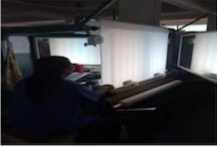
FABRIC FIRST TIME CHECKING