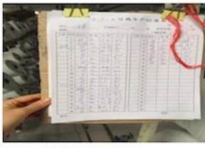
DETAILS NOTE DOWN