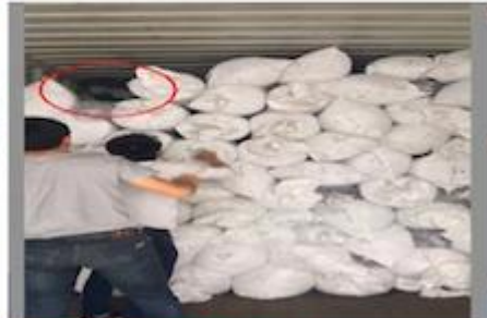
TRY BEST TO LOAD FULL