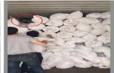
TRY BEST TO LOAD FULL