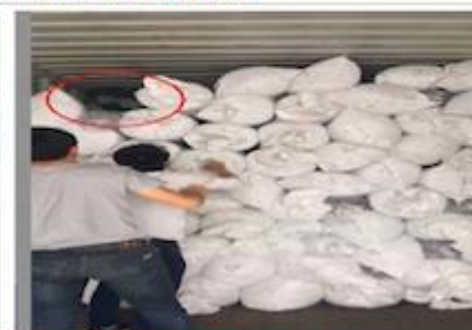
TRY BEST TO LOAD FULL