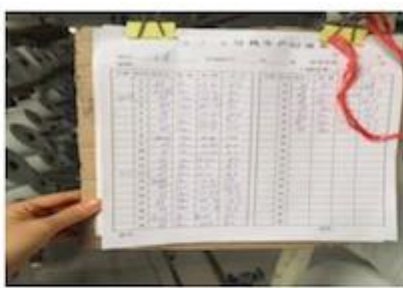
DETAILS NOTE DOWN