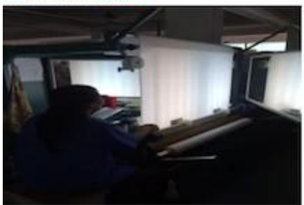
FABRIC FIRST TIME CHECKING